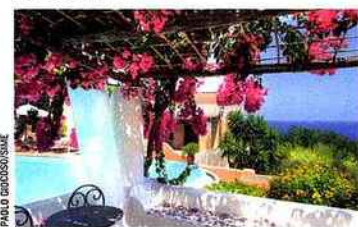
PAOLO DI GIOIOSA/S/AGE

Dans un bel hôtel dominant la mer, un spa couleur terre déploie ses bassins à ciel ouvert. Des bassins d'eau chaude, tiède, fraîche ou bouillonnante, des jets pour se prélasser, un parcours glacé pour revigorer les gambettes fatiguées et un hammam caché dans une hutte ronde, typique des îles Eoliennes pendant l'Antiquité. Très nature, le spa de l'hôtel Signum utilise la géothermie du sous-sol volcanique. De même que les crèmes, onguents et huiles prodigués lors des soins sont confectionnés avec les amandes, olives, oranges amères et figues de Barbarie de l'île. On aime ainsi le bain relaxant au lait d'amande que l'on prend dans une superbe baignoire en cuivre. Salus per Aquam, spa de l'hôtel Signum, Malfa (00.39.09.09.84.42.22 ; www.hotelsignum.it ). A partir de 25 € le soin.